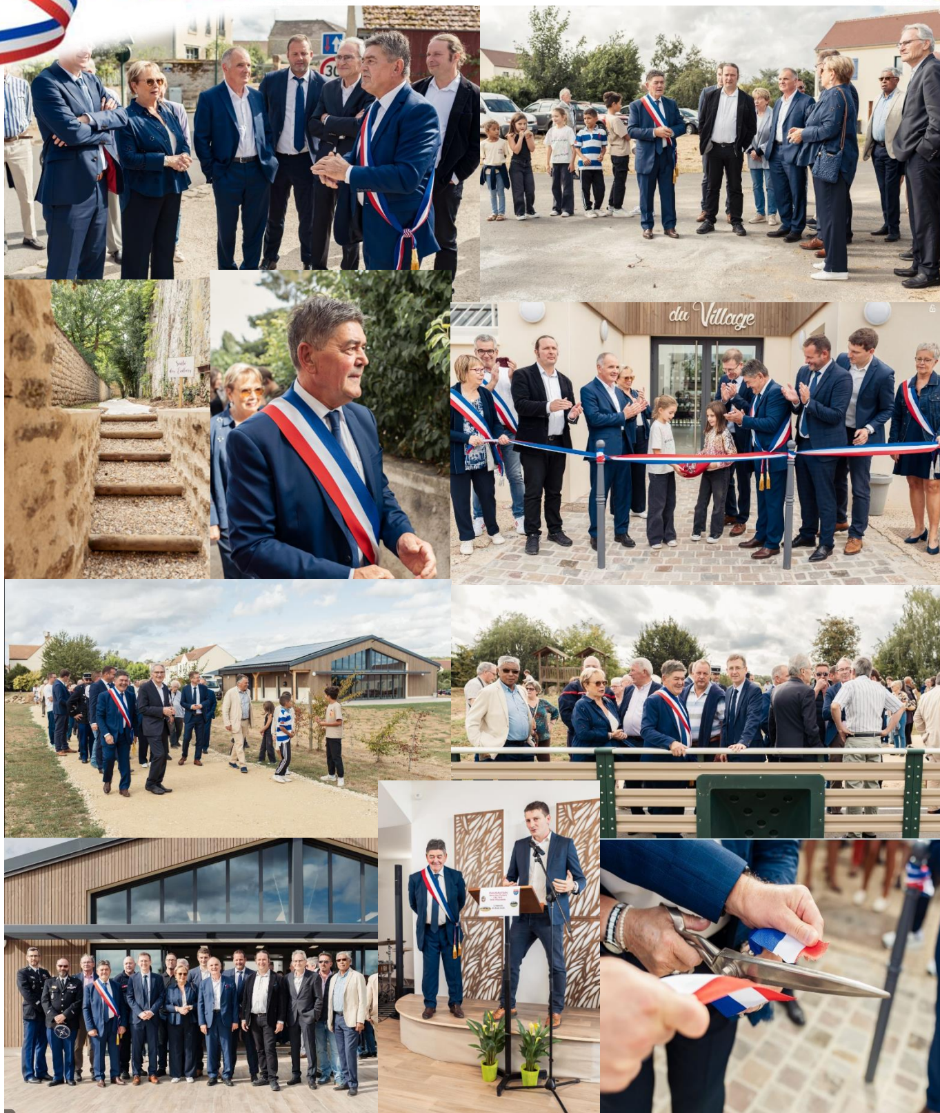
Inauguration de la Maison du Village du 30 août 2025