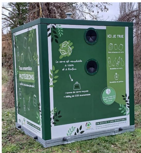
Nouveau contenant à verre insonorisé situé Chemin des Marais